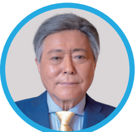
タレント 小倉 智昭 さん

8歳のときに1型糖尿病を発症。「1型糖尿病でも何にでも挑戦できる」をモットーに、4歳から始めたエアロビックでは2002年、2003年にジュニアの世界チャンピオンになる。引退後は元日本代表選手として教育機関や各種イベント等での講演や実演、運動指導などを行っている。